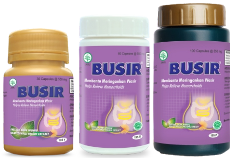
30 Kapsul 60 Kapsul 100 Kapsul POM TR 082 378 551 BUSIR Membantu meringankan gejala wasir Helps relieve hemorrhoids symptoms