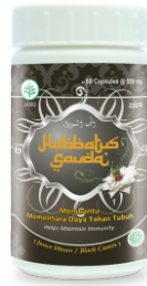
60 Kapsul POM TR 112 326 781 BRD HABBATUS SAUDA Membantu memelihara daya tahan tubuh Helps maintain immunity