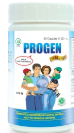
60 Kapsul POM TR 082 384 851 PROGEN Membantu memperbaiki nafsu makan Help to improve appetite