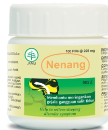
100 Pil POM TR 182 414 731 NENANG