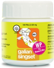
100 Pili POM TR 152 483 741 GALIAN SINGSET WP WANITA PRIA Membantu mengurangi lemak tubuh Help to reduce body fat