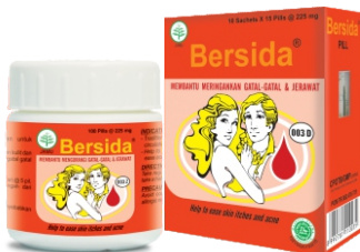
100 Pili 15 Pili POM TR 152 484 161 POM TR 082 476 731 BERSIDA

Membantu meringankan jerawat dan gatal-gatal Help to ease skin itches and acne