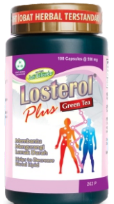
100 Kapsul POM TR 172 300 641 LOSTEROL PLUS Membantu mengurangi lemak darah Helps to decrease blood lipid