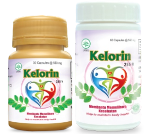
30 Kapsul 60 Kapsul POM TR 142 383 131 KELORIN Membantu memelihara kesehatan Helps maintain body health