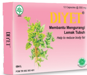
12 Kapsul POM TR 082 383 401 DIYET Membantu mengurangi lemak tubuh Help to reduce body fat