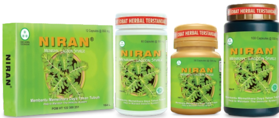
12 Kapsul 60 Kapsul 30 Kapsul 100 Kapsul POM HT 122 300 251 POM HT 122 300 231 NIRAN Membantu memelihara daya tahan tubuh helps maintain immunity