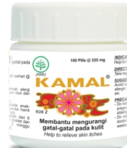
100 Pil POM TR 182 418 231 KAMAL Membantu mengurangi gatal-gatal pada kulit Help to relieve skin itches