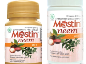
30 Kapsul 60 Kapsul POM TR 152 387 881 MASTIN NEEM Membantu meringankan jerawat dan gatal-gatal Help alleviate acne and itching