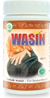
60 Kapsul POM TR 082 384 841 WASIN Membantu meringankan wasir Helps to alleviate hemorrhoids symptoms