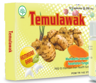
12 Kapsul POM TR 142 379 971