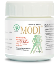
30 Pili POM TR 182 411 721 MODI Membantu mengurangi lemak tubuh Help to reduce body fat and body weight