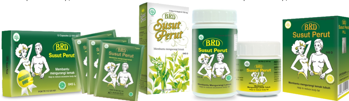
12 Kapsul POM TR 112 325 481 Seduhan POM TR 082 283 161 30 Kaplet POM TR 082 583 451 60 Kapsul POM TR 082 383 481 100 Pili POM TR 152 484 891 15 Pili POM TR 082 483 141 BRD SUSUT PERUT Membantu mengurangi lemak tubuh Help to reduce body fat