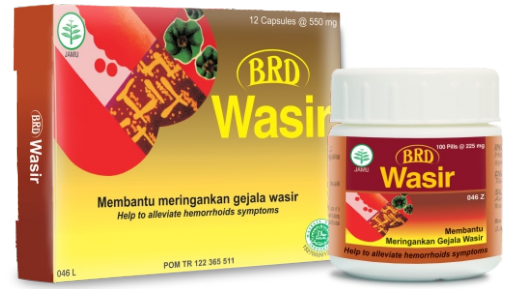
12 Kapsul 100 Pil POM TR 122 365 511 POM TR 153 484 121 BRD WASIR Membantu meringankan gejala wasir Help to alleviate hemorrhoids symptoms