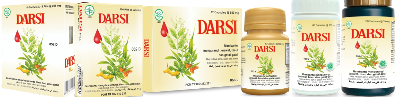
15 Pili POM TR 002 410 331

Membantu mengurangi rasa gatal dan kudis Help to reduce itches and scabies