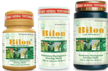
30 Kapsul 60 Kapsul 100 Kapsul POM HT 112 300 071 BILON

Membantu meringankan kencing manis Help to alleviate diabetes