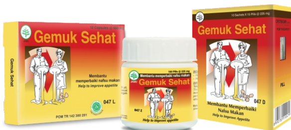
12 Kapsul 100 Pil 15 Pil POM TR 142 380 281 POM TR 152 484 171 POM TR 082 495 071 GEMUK SEHAT Membantu memperbaiki nafsu makan Help to improve appetite