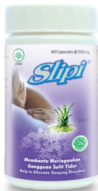
60 Kapsul POM TR 062 363 541 SLIPI