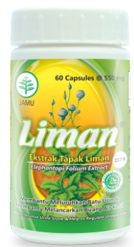
60 Kapsul POM TR 112 327 171 LIMAN

Membantu meluruhkan batu urin di ginjal dan saluran kemih, Membantu melancarkan buang air kecil Help to dissolve oxalate crystals in the kidney & bladder, Smooth urination