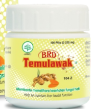
100 Pil POM TR 162 498 231