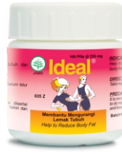
100 Pili POM TR 082 482 031 IDEAL Membantu mengurangi lemak tubuh dan memelihara kesehatan Help to reduce body fat and maintain the body health