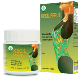
100 Pili POM TR 072 470 071 KECIL PERUT Membantu mengurangi lemak tubuh Help to reduce body fat