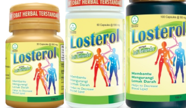
30 Kapsul 60 Kapsul 100 Kapsul POM HT 172 300 621 LOSTEROL Membantu mengurangi lemak darah Helps to decrease blood lipid