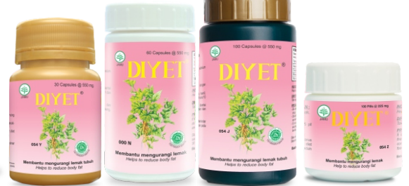
30 Kapsul POM TR 092 303 581 60 Kapsul 100 Kapsul POM TR 082 483 051 DIYET Membantu mengurangi lemak tubuh Help to reduce body fat