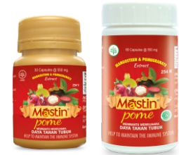
30 Kapsul 60 Kapsul POM TR 142 383 021 MASTIN POME Membantu memelihara daya tahan tubuh Helps to maintain the immune system