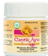
100 Pili POM TR 062 461 851 CANTIK AYU

Membantu meringankan jerawat dan gatal-gatal Help to ease skin itches and acne