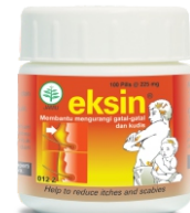
100 Pili POM TR 142 480 291 EKSIN

Membantu memelihara kesehatan kulit Helps to maintain skin health