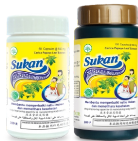
60 Kapsul 100 Kapsul POM TR 092 307 601 SUKAN Membantu memperbaiki nafsu makan dan memelihara kesehatan Helps to improve appetite and maintain body health