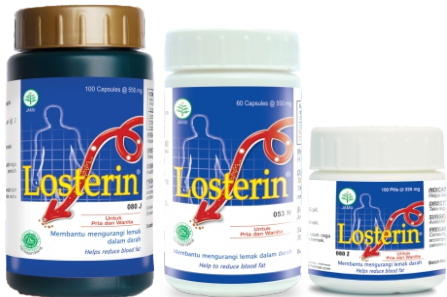
100 Kapsul 60 Kapsul 100 Pil POM TR 042 336 881 POM TR 152 484 281 LOSTERIN Membantu mengurangi lemak darah Helps reduce blood fat