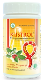
60 Kapsul POM TR 112 327 201 KUSTROL Membantu mengurangi lemak darah Help to reduce blood fat