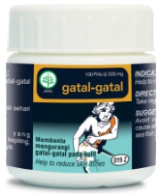
100 Pil POM TR 142 481 631 GATAL-GATAL Membantu mengurangi gatal-gatal pada kulit Help to reduce skin itches