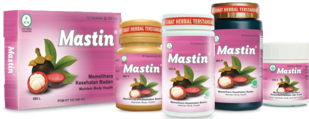
12 Kapsul 30 Kapsul 60 Kapsul 100 Kapsul 100 Pil POM HT 122 300 181 POM HT 122 300 191 POM TR 172 404 111 MASTIN Memelihara kesehatan badan Helps to maintain body health