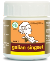
100 Pili POM TR 062 462 351 GALIAN SINGSET Membantu mengurangi lemak tubuh Help to reduce body fat