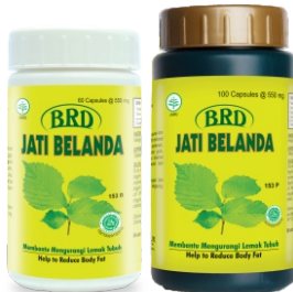
60 Kapsul POM TR 062 356 251 BRD JATI BELANDA Membantu mengurangi lemak tubuh Help to reduce body fat