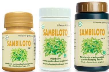
30 Kapsul 60 Kapsul 100 Kapsul POM TR 062 356 961 BRD SAMBILOTO

Secara tradisional digunakan untuk membantu meringankan gejala kencing manis Traditionally used to help alleviating diabetes