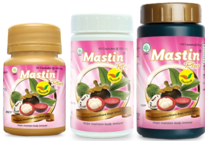
30 Kapsul 60 Kapsul 100 Kapsul POM TR 142 380 691 MASTIN PLUS Membantu memelihara daya tahan tubuh Helps to maintain body immune