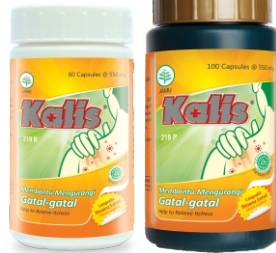
60 Kapsul 100 Kapsul POM TR 112 326 811 KALIS Membantu mengurangi gatal-gatal Help to relieve itches