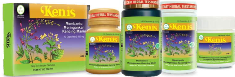
12 Kapsul POM HT 112 300 111

Membantu meringankan gejala kencing manis Help to relieve diabetes symptoms