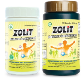
60 Kapsul 100 Kapsul POM TR 082 383 611 ZOLIT Membantu memelihara kesehatan dan membantu menyegarkan badan Helps for maintaining body health and helps provide fitness