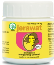
100 Pil POM TR 072 471 701 JERAWAT Membantu mengurangi jerawat Help to reduce acne