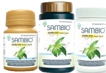
30 Kapsul 100 Kapsul 60 Kapsul POM TR 142 381 071 SAMBIO Membantu memelihara daya tahan tubuh help to maintains body immune