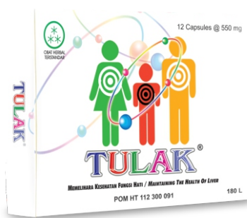
12 Kapsul POM HT 112 300 091